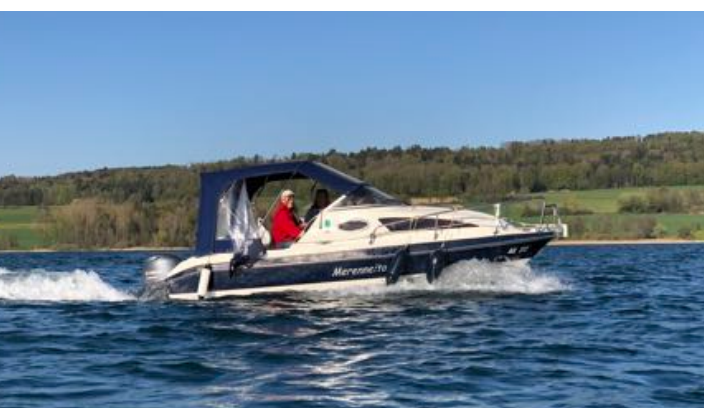
Wir begleiten Euch bis zur praktischen Prüfung!

Übrigens der theoretische Teil ist für Segler und Motorbootfahrer derselbe. Und wer wetterbedingt zögert noch dieses Jahr mit Lektionen zu beginnen: unsere Aqualine ist ein beheiztes Boot.